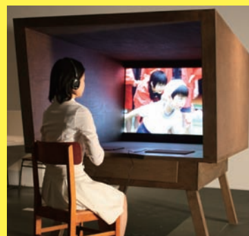
安藤英由樹+渡邊淳司+佐藤雅彦 《心音移入》 2010年 聴診器 ヘッドフォン 映像 鼓動 作家蔵

熊本市現代美術館 CONTEMPORARY ART MUSEUM, KUMAMOTO