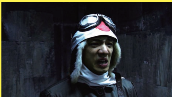
小泉明郎 《若き侍の肖像》2009年 ビデオ・インスタレーション 作家蔵