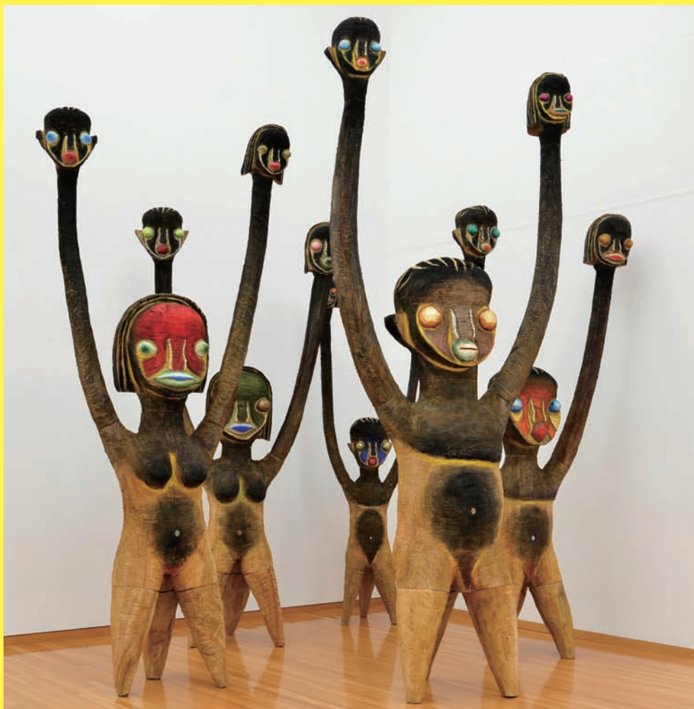
加藤泉 《Untitled》2014年 木 アクリル ステンレス 作家蔵 ©2014 Izumi Kato